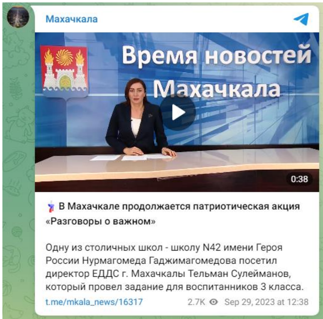
Скрин телеграм-канала «Махачкала» (Официальный канал Администрации города Махачкалы). Дата публикации 29.09.2023